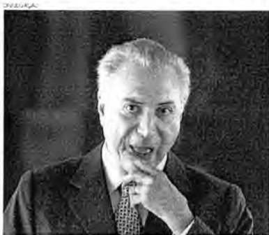
O texto será enviado pelo presidente Michel Temer nesta segunda-feira