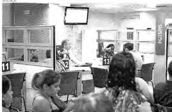
De acordo com a legislação, a remuneração básica das contas do FGTS é de 3% ao ano, além da variação da TR

De acordo com a legislação, a remuneração básica das contas do FGTS é de 3% ao ano, além da variação da Taxa Referencial (TR). Como a inflação vinha ficando muito alta — em 2015, chegou nos 11% —, os trabalhadores estavam